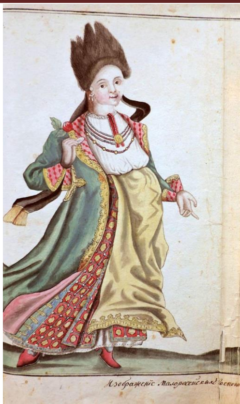
Рис. 9. Малороссійская госпожа в старинном наряде. О. Шафонський, 1786 (Шаменков, 2020).

Зважаючи на приклад з волинських документів XVI ст., який ми обговорювали, можна висунути версію, що жінки з козацької старшини іноді носили плахту для зручності, але схоже, що вона не була їх основним, і, тим паче, парадним одягом. Згадувана вже Анастасія Скоропадська 1727 р. подарувала доньці Данила Апостола «кунтушь богатий златоглавній, горностоями подшитий а огонками опушеній, сподницю златоглаву на табине, шнуровку шитую красную аксамитную» (Дневник, 1895: 184-185), – це майже повний жіночий комплект того часу, але плахта, як бачимо, в ньому відсутня.