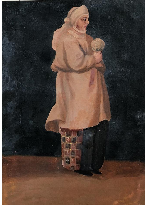
Рис. 6. Дружина хлібороба. Бергольц, 1744 (Косміна, 2024).

Стосовно узорів плахт, на малюнках Ф. Бергольца додаткове заповнення клітинок іншим кольором бачимо тільки в 3 випадках: чорні плями на червоній плахті дружини українського селянина (рис. 5); чорні та червоні клітинки, що мають додаткове перехрещення світлих ниток усередині – на дружині хлібороба (рис. 6); майже такий самий малюнок, але з більш яскравим червоним, – на міській служниці (рис. 7).