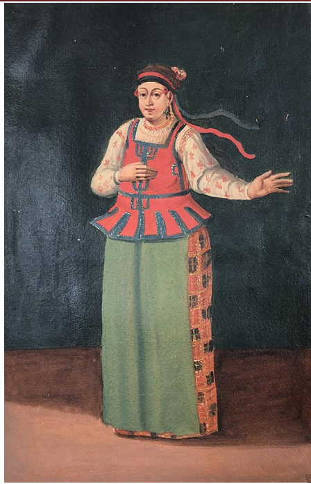
Рис. 7. Міська служниця. Ф. Бергольц, 1744 (Косміна, 2024).

Найцінніше те, що для XVIII ст. нарешті маємо речові джерела. Це кілька плахт та їх фрагментів з Чернігівського обласного історичного музею ім. В.В. Тарновського (далі – ЧОІМ), які можна датувати другою половиною XVIII ст. Найближча за дизайном узору до плахт на малюнках з рукопису О. Шафонського темно-червона плахта з чорними, бордовими та світлими нитками, які утворюють клітинки (Плахта, 2018а). Дуже схожі узор та колористику бачимо на чернігівській плахті кінця XIX ст. зі збірки Національного музею у Львові ім. Андрея Шептицького (Полтавські сорочки, 2023: 52-53). До простих дизайнів на малюнках Ф. Бергольца ближчі деякі плахти першої половини XIX ст. (Плахта першої, 2018а, б, с). Ще дві плахти з ЧОІМ, синьо-жовта (Плахти з зібрання, 2013) та вишнево-зелена (Плахта, 2018б) мають те саме заповнення «квітками», яке стає масовим у плахт XIX ст. Але, що цікаво, кольорова гама цих двох зразків не дуже характерна для плахт XIX ст., судячи з опублікованих музейних і приватних колекцій.