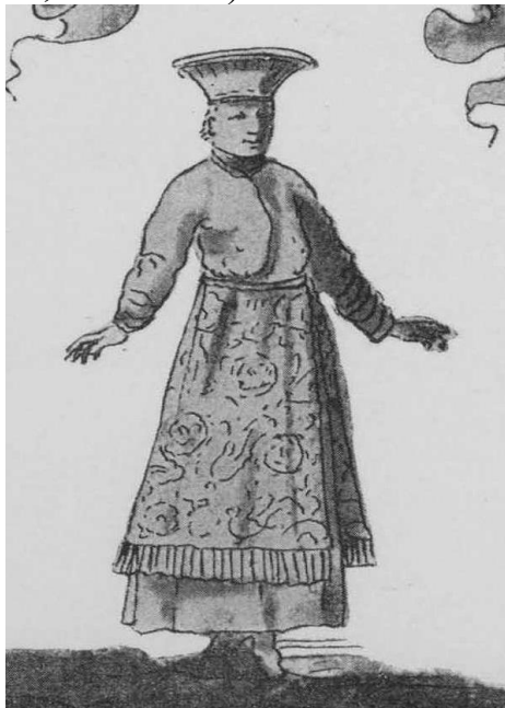
Рис. 4. Жінка з Московії, 1661-1662 гг. (Альбом Мейєрберга, 1903).