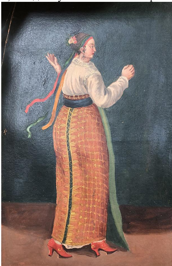
Рис. 1. Міська служниця. Ф. Бергольц, 1744 (Косміна, 2024).

Підтвердження тому факту, що на землях Гетьманщини плахту в XVII ст. зшивали з двох половинок, знаходимо в справі від 1688 р., коли Олена Адамович з Ніжина у передає у спадок «плахту черчатую не зшитую» (Доба гетьмана, 2007: 976). На зображальному джерелі цей серединний шов позаду плахти вперше спостерігаємо вже в XVIII ст., на одному з малюнків Ф. Бергольца (рис. 1).