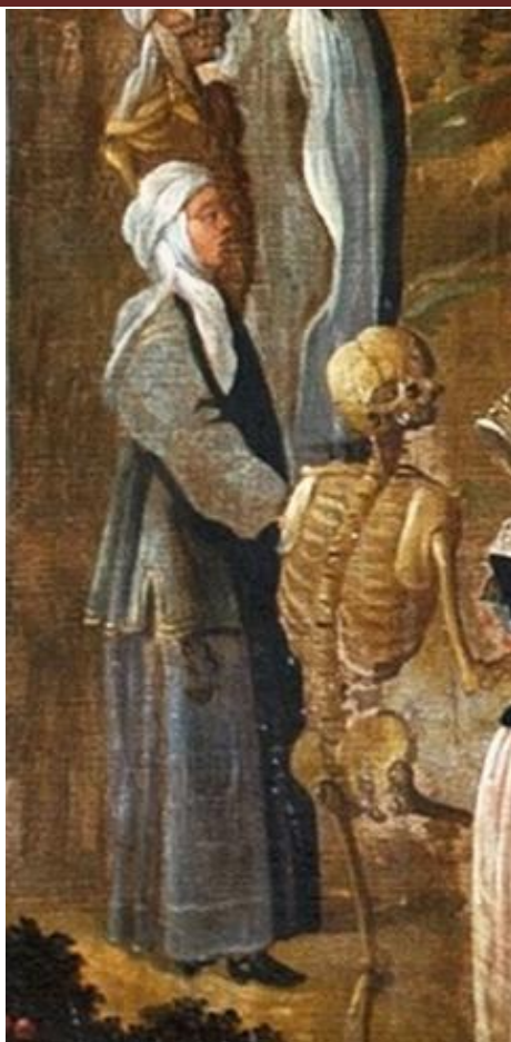
Рис. 2. Танець смерті (фрагмент) з костелу бернардинів у Кракові, 1670-ті роки (Danse macabre, 2024).

На одній з жінок, яка за комплектом одягу найбільше схожа на селянку, бачимо картату спідницю, синю в білі перехрещені (перпендикулярні) смужки. Вона доволі простора як для обтислих плахт, котрі ми обговорювали раніше, до того ж жінку зображено боком і неможливо сказати, чи є в цього поясного одягу передній розріз. Однак ця «спідниця» є картатою, а розмір клітин та кольори збігаються з однією з плахт, зображених на малюнку Ф. Бергольца, зробленому 1744 р. (рис. 3).