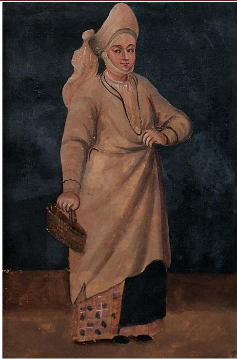
Рис. 5. Ф. Дружина українського селянина. Бергольц, 1744 (Косміна, 2024).

Втім, цю явно неповну статистику доповнюють зображальні джерела XVIII ст. В першу чергу, це малюнки Ф. Бергольца від 1744 р., які було введено в науковий обіг зовсім нещодавно (Косміна, 2024; Шаменков, 2024). На них бачимо мінімум 11 плахт – деякі з них ледве видно, але можна розрізнити колір клітинки. Дві з них темно-сині з білими або жовтуватими смужками (на дівчині-селянці та на заміжній жінці), шість – червоні з золотавими смужками (на дівчині-селянці, міській дівчині-служниці, двох жінках з міста та двох літніх жінках, одна з села), три червоно-чорних з золотавими та білими смужками (на міській дівчині-служниці та двох сільських жінках). На малюнках з рукопису О. Шафонського, які датуються вже 1786 р., у двох випадках бачимо червоний з жовтим (з домінуванням червоного), в одному – зелений з жовтим і синім, ще в одному – синій з червоним та жовтим (Шаменков, 2020: 48, 53-55).